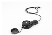
Sonda de luxómetro LP-10B (conector PS/2) (para LXP-10B)