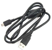
Cable de transmisión de datos mini USB