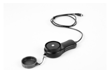
Sonda de luxómetro LP-10A (conector PS/2) (para LXP-10A)